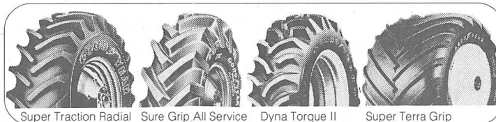
Super Traction Radial Sure Grip All Service Dyna Torque II Super Terra Grip

Tip: keine Reifen montieren ohne unsere Offerte!