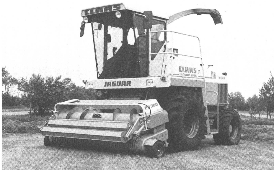
Der neue Jaguar 695 MEGA – das Spitzenmodell in der Typenreihe der selbstfahrenden Claas-Feldhäcksler.

Claas rechnet in diesem Jahr nicht mit einer Belebung der Nachfrage. Vor allem die unentschlossene EG-Agrarpolitik und die noch nicht abgeschlossenen GATT-Verhandlungen werden weiter zu einer zurückhaltenden Stimmung in der europäischen Landwirtschaft beitragen. Mittelfristig ist das