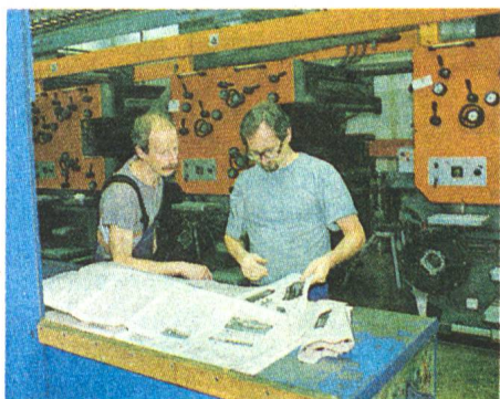
Grosser Augenblick bei der Druckerei Huber & Co. AG in Frauenfeld: Die ersten Seiten für die neue «Schweizer Landtechnik» und AGRAMA-Ausgabe werden auf der Rotations-Offsetmaschine bedruckt und kritisch unter die Lupe genommen...

Wenn man annimmt, dass das Gros der Ausstellungsbesucher bereits Mitglied unseres Verbandes ist, dürfen auch die Kontakte zu (Noch-)Nichtmitgliedern als erfreulich bezeichnet werden. Immerhin konnten auch über 30 Neumitgliedern geworben werden. Die beiden Sektionen Thurgau und St.Gallen haben die Plattform an der AGRAMA genutzt. Deren Vorstandsmitglieder begrüsst ihre Mitglieder am «Thurgauer» -bzw. am «St.Galler»-Tag persönlich. Der persönliche Kontakt aber ist für die Verbandstätigkeit am wichtigsten. Diesen Kontakt pflegt auch das Verbandsorgan «Schweizer Landtechnik», das am SVLT-Stand in neuer Aufmachung auflag. Für das ihr entgegengebrachte Interesse sei an dieser Stelle herzlich gedankt.