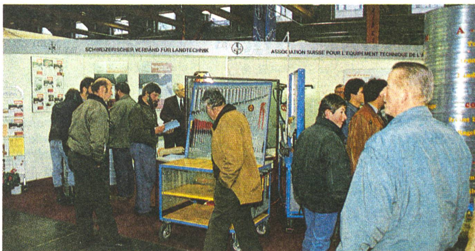
Ein Publikumsmagnet an der AGRAMA: zentralgelegener Ausstellungsstand des SVLT.

Im Rahmen des neuen Ausstellungs-konzeptes des Schweizerischen Landmaschinenverbandes bestand für unseren Verband von allem Anfang an kein Zweifel über die Wichtigkeit der Präsenz an der neuen AGRAMA. Das Angebot der Ausstellungsleitung, den vier Organisationen FAT, BUL SMU und SVLT eine Standfläche an sehr zentraler Lage zur Verfügung zu stellen, wurde deshalb sehr begrüsst. Neuerdings wird also der SVLT alternierend an den Ausstellungen in Lausanne und in St.Gallen vertreten sein. SVLT-Direktor Werner Bühler zeigte sich sehr befriedigt über das unserem Verband entgegengebrachte Interesse. In vielen Gesprächen habe sich die Gelegenheit geboten, über die Leistungen zugunsten der Landwirtschaft zu diskutieren. Schwerpunktmässig wurde auf die Aus- und Weiterbildungskurse in den neuen Werkstätten in Riniken und auf die Nutzung von EDV für die Betriebsführung im speziellen und für den All-tag im allgemeinen hingewiesen.