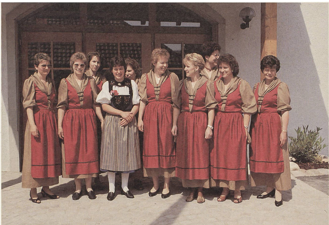
Riniker Landfrauen verschönern das Fest ...