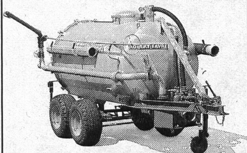
SAUG-DRUCKFASS MARCHNER vertrieben durch