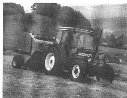
Der Fiat-Primo Jubiläumstraktor mit 60 oder 66 PS setzt neue Massstäbe.

Neu ist beim Fiat-Primo das serienmässig eingebaute 12/12-Gang-Revisiergetriebe mit der Schweizer Gangabstufung. Die 3-Punkt-Hydraulik wird, wie bei allen Fiat-Traktoren, über die Unterlenker geregelt. Die exklusive Liftomatic erleichtert dem