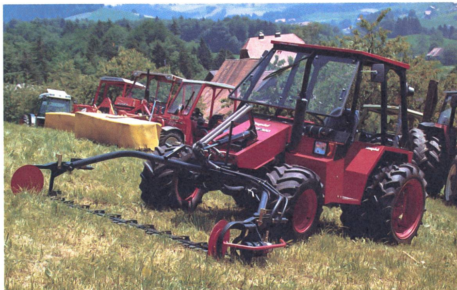
Moderne Hangmechanisierung: Frontmähwerke mit guten Flächenleistungen an der Maschinenvorführung der Sektion Zug des SVLT.

Nicht jedes der vorgeführten Fahrzeuge konnte die optimale Leistung erbringen. Traktoren mit Front- und Heckgeräten mussten, trotz Doppelbereifung hinten und vorne, als zu schwer eingestuft werden. Auch von den Zweiachsmähern mit Frontmähwerken konnte nicht jedes Fabrikat die gleiche gute Leistung vollbringen. Bei einigen gab es Probleme bei der Anpassung des Frontmähwerkes an die Bodenungleichheiten. Als sehr wichtig konnte die Bereifung betrachtet werden: Doppel- oder Breitbereifung bedeutet Sicherheit auf Hangpartien. Es ist in diesem Zusammenhang zu vermerken, dass sich in der Schweiz jährlich mehrere schwerwiegende Unfälle oft mit tödlichem Ausgang beim Befahren von Hängen ereig-