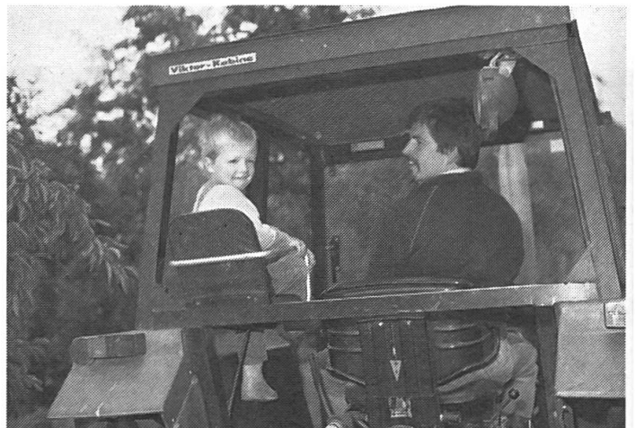
Kinder unter sieben Jahren dürfen nur auf gesicherten Kindersitzen oder in Begleitung Erwachsener mitfahren.

Kinder sollten möglichst wenig auf landwirtschaftlichen Motorfahrzeugen mitfahren. Dies betrifft insbesondere Kinder bis zu 12 Jahren. Sie sind auf landwirtschaftlichen Fahrzeugen besonders gefährdet. Ein einigermaßen sicheres Mitfahren ist nur innerhalb einer geschlossenen Sicherheitskabine möglich. Sind Kinder weniger als 7 Jahre alt, dürfen sie nur auf gesicherten Kindersitzen oder in Begleitung Erwachsener mitfahren. Aber: Die Schwingungen im Traktor sind für Kinder schädlich. Vermeiden sie jedenfalls längeres Mitfahren!