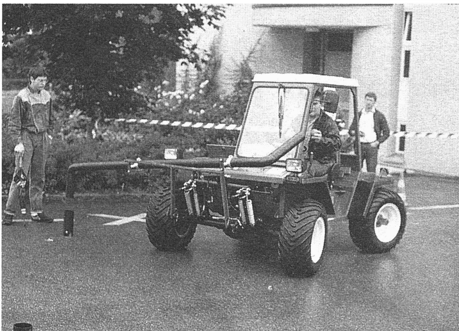
Mit «fahren und treffen» könnte diese Station im Parcours umschrieben werden.