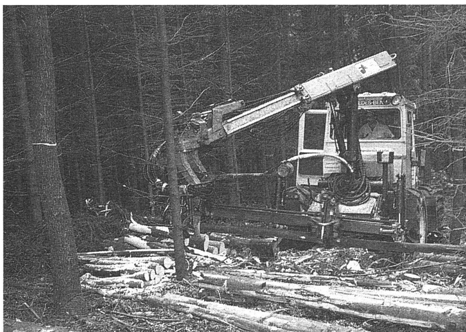
Zwei neue Arbeitsmaschinen, die vom Forstunternehmen auf den in regelmässigen Abständen angelegten Rückegassen eingesetzt werden: Processor und...

Die Fachmesse für Forstwesen, die Ende August in Luzern stattgefunden hat, ist die umfassendste Schau für die Geräte der Waldwirtschaft. Sie stand im Zeichen einer vorsichtig positiven Einschätzung der Holzpreise und des Gesundheitszustandes des Waldes. Starken Aufwind verliehen haben der Waldwirtschaft drittens die staatlichen Unterstützungsbeiträge. Deshalb stiess die 10. Auflage der Luzerner Ausstellung sowohl bei den Ausstellern – die Messeleitung beklagte sich bei den Stadtbehörden bereits über den akuten Platzmangel – als auch bei den Besuchern auf ein grosses Echo. Der Fächer des Ausstellungsangebotes reichte von der persönlichen, Schutz gebenden Arbeitsklei-