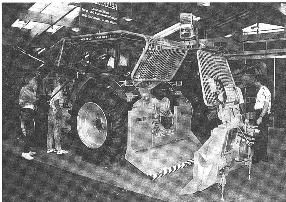
Der gesicherte Arbeitsplatz spart Zeit und Nerven.

derung und Ausrüstung über die kleinen, technischen Wunderwerke an Handgeräten für die Waldarbeiten bis zu den Mittel- und Grossanlagen der Brennholzverarbeitung und den in Skandinavien entwickelten Vollernter für die Schwachholzernte.