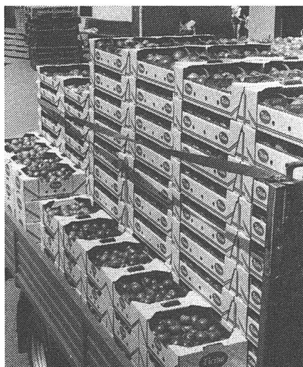
Tomaten – Hauptprodukt der Gemüseproduzenten