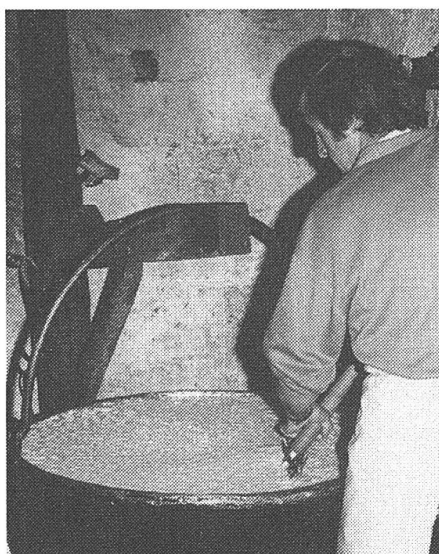
Auf der Alp Casaccia am Lukmanier