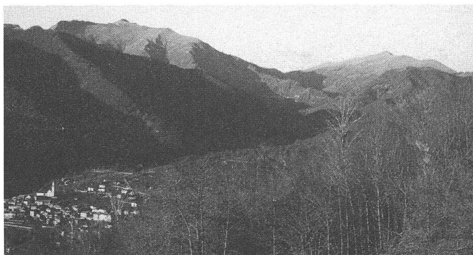
Valle Muggio mit Monte Generoso