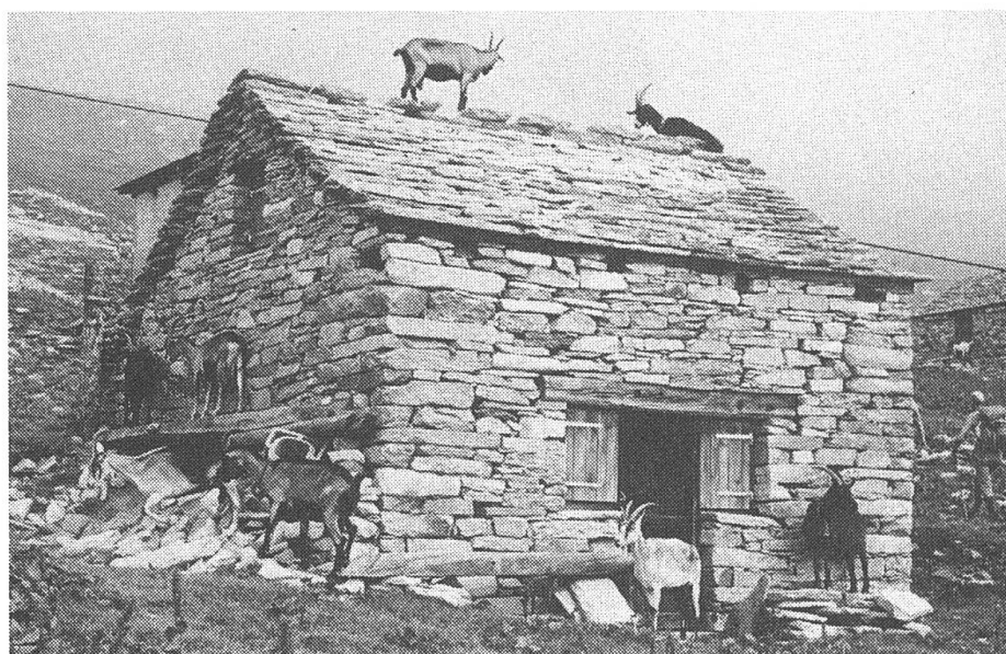
Grossalp Bosco Gurin, Ziegen gehören zur Tessiner Alpwirtschaft