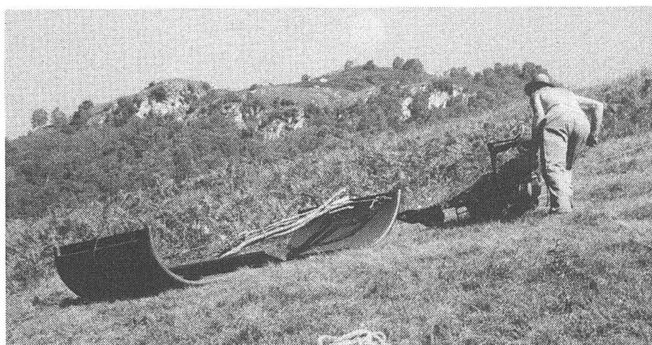
Harte Arbeit – karger Boden im Valle di Mergoscia im Einzugsgebiet der Verzasca