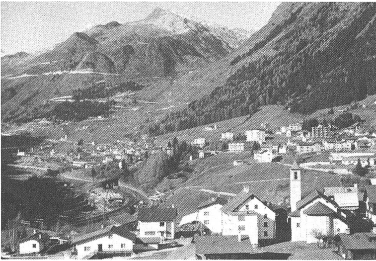
Airola und San Gottardo