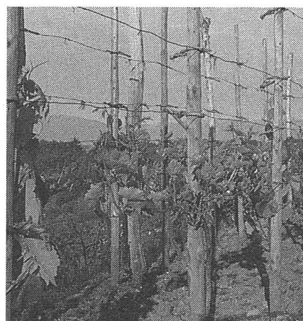
Nostrano-Trauben im Malcantone