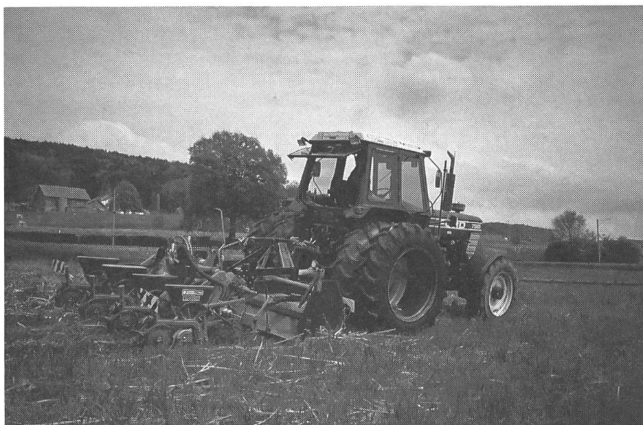
Streifenfrässaat, bestehend aus einem abgeänderten Zinkenrotor mit nachgebautem Einzelkornsägerät. Schwerer Traktor nötig.

Der Ehemaligenverein der Landw. Schule Oberland in Wetzikon unternahm es am 5. Mai 1988 auf dem Betrieb Büelweid von E. Bosshard in Pfäffikon zusammen mit der kant. Zentralstelle für Maschinenberatung in Winterthur, die wichtigsten