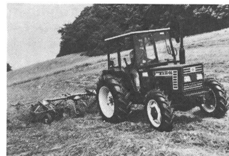
Fiat 55-66, «Leichtfüsser».

Die Firma Bucher-Guyer zeigt auf einem attraktiven Stand direkt beim Haupteingang verschiedene landtechnische Neuheiten. Die «leichtfüssigen» Fiat-Traktoren sind Modelle mit kleinem Eigengewicht entsprechend der Motorengrösse. Damit wird eine geringere Bodenverdichtung erreicht. Die «superelastischen» Modelle besitzen neben drehmomentsstarken Motoren ein ganz neues Reversiergetriebe. Ohne zu kuppeln können die Halbgänge während der Fahrt geschaltet werden.