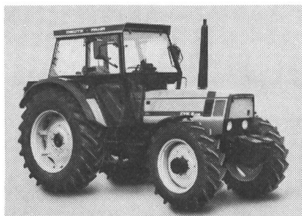
Der neue 6-Zylinder-Traktor DX 6.05 von DEUTZ-FAHR mit 98 PS.

Die KHD Agrartechnik GmbH hat jetzt ihr Traktoren-Typenprogramm in dem wichtigen Leistungsbereich von 66–74 kW (90–100 PS) um einen neuen kompakten und sehr wirtschaftlichen 98-PS-Traktor mit der Typenbezeichnung DX 6.05 erweitert.