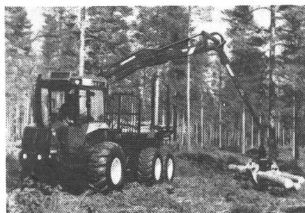
Neuer Forstkran «Cranab 60».

Das Forstkranprogramm des Herstellers Cranab, der auch in der Pro-