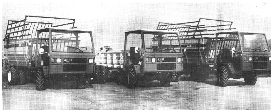
Von links nach rechts: Aebi-Transporter TP 27, TP 45 und TP 65.

Mit dem Erscheinen des kleinsten Modells Aebi TP 27 ist nun die