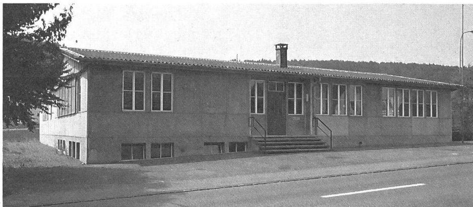
1 Kurszentrum des SVLT in Riniken.

Mit einem breiten Kursangebot versucht der SVLT dem Umstand Rechnung zu tragen, dass der Landwirt sich heute als Fachmann in den verschiedensten technischen Bereichen bewähren muss. Die vielfältigen