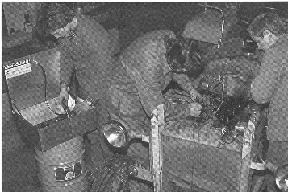
2 In verschiedenen Kursen wird den Teilnehmern die Möglichkeit geboten unter fachkundiger Anleitung ihre eigenen Landmaschinen einer eingehenden Revision zu unterziehen.