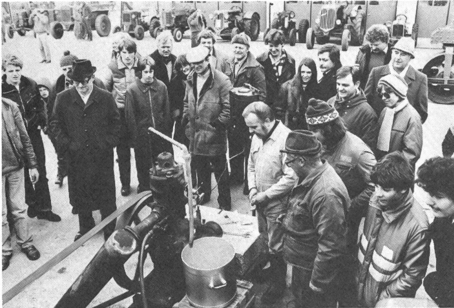
Abb. 2: Der Glükkopfmotor fand auch Anwendung als stationäre Antriebsmaschine.