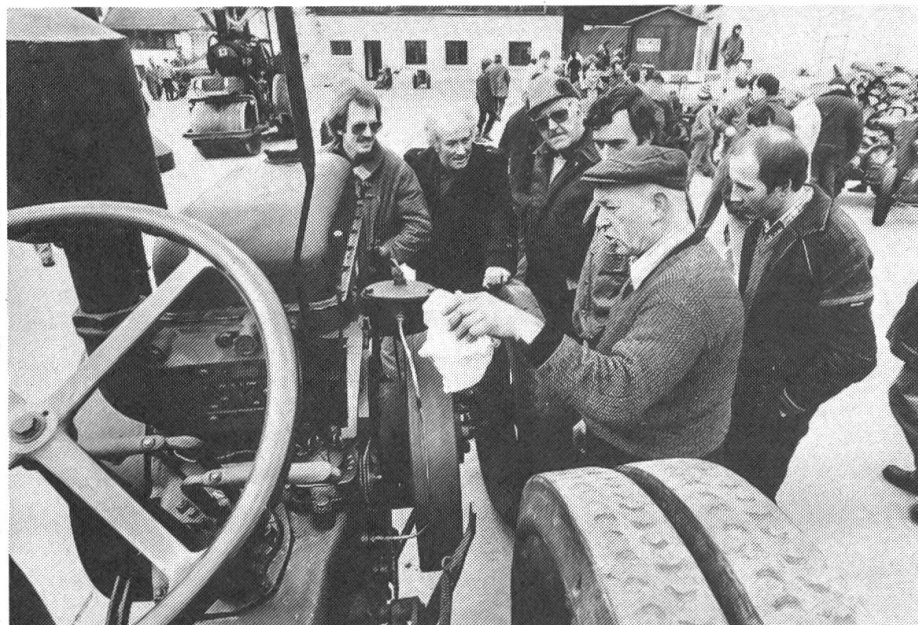
Abb. 3: Natürlich wurde bei den Veteranen – sehr zum Stolz der Besitzer – auch «gefachsimpelt», wie hier bei einem Lanz-Bulldog aus dem Jahre 1926. Rund 1000 Stunden werden in die Revision eines Oldtimer-Traktors gesteckt.