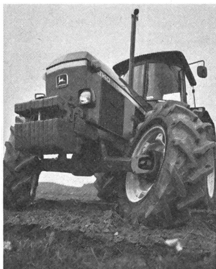
Abb. 1: Das John Deere-Traktorenprogramm umfasst Typen im Leistungsbereich zwischen 41 und 270 DIN-PS, Typ 3140, 100 PS (74 kW), Allradantrieb, Komfort-Kabine SG-2 und exklusive neue Vorderachse mit einem Einschlagwinkel von 50°.

Hauptlieferant der Matra, die John Deere & Company, in den letzten vier Jahren 800 Millionen $ in neue Fabrikationsanlagen