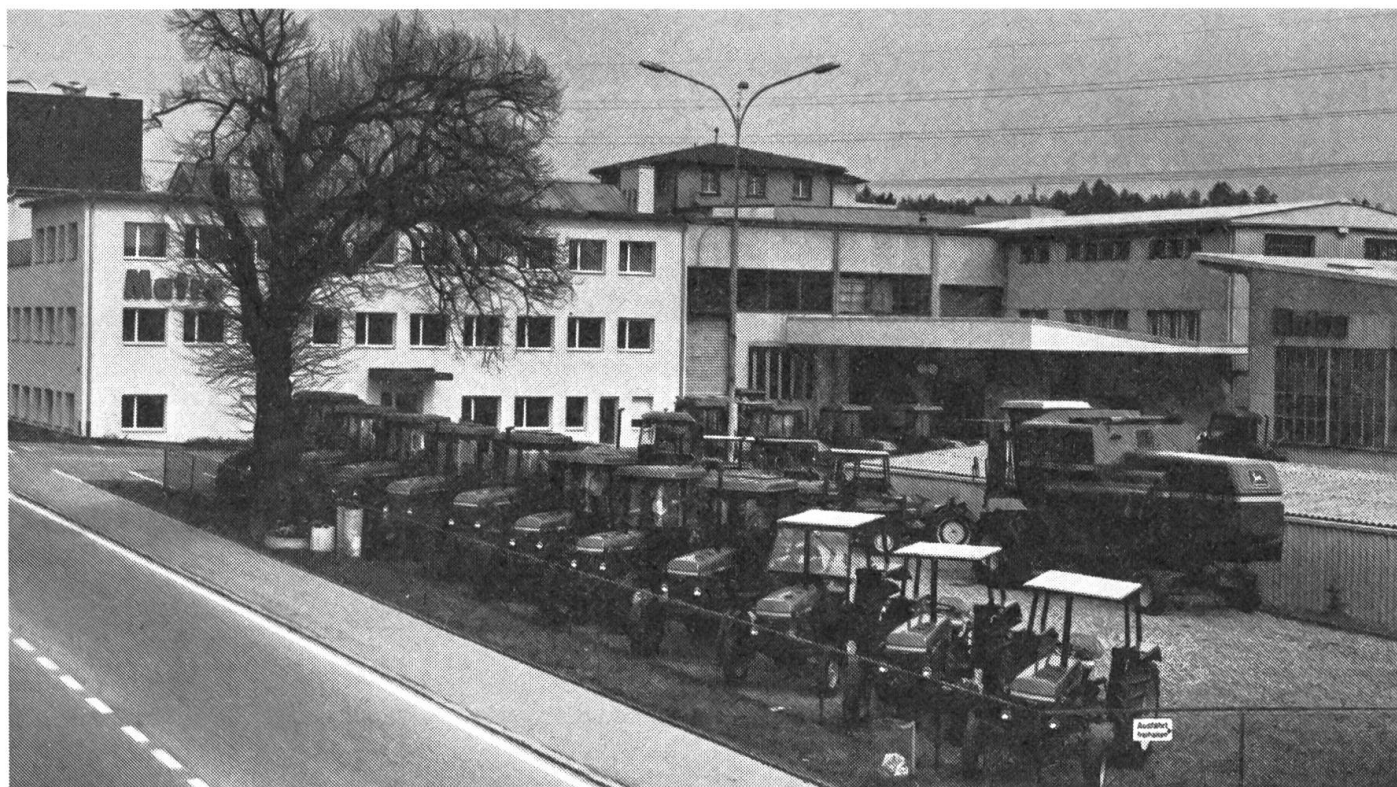
SW-Ansicht der Firma (von der Durchfahrtsstrasse aus)