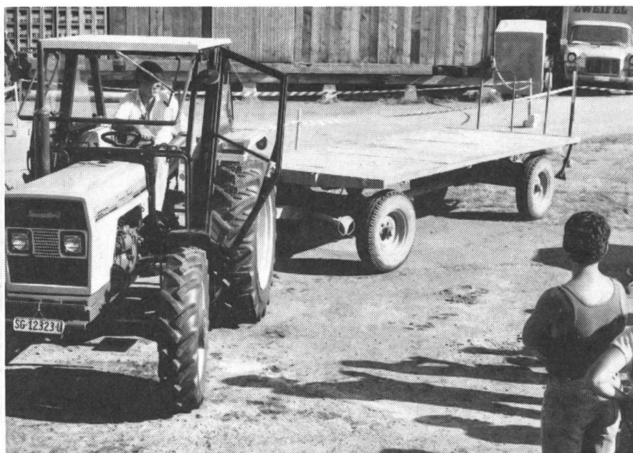
Abb. 3: Rückwärtsfahren mit einem Zweiachsanhänger. Eine «klassische» Übung, die im Zeitalter des Einachers manchen Teilnehmer zum Schwitzen brachte.