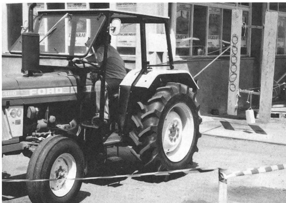
Abb. 1: Ringe umhängen mit einem Hydraulik-Ausleger. Eine Arbeit, die ein gefühvolles Bedienen der Hydraulik erfordert.

* vom 26. August 1984 auf Planeyse, Colombier NE