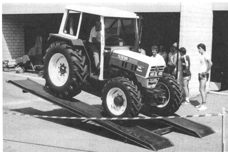
Abb. 4: Auf der Wippe im Gleichgewicht anhalten. «Gewusst wie» – wurde hier verlangt.

Nachstehend veröffentlichen wir Auszüge aus den Ranglisten: