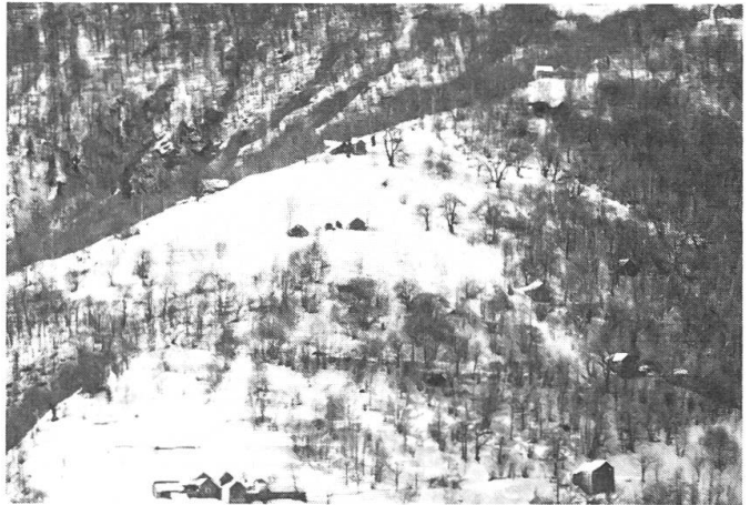
Abb. 3: Das zweite Pilotprojekt führt auf die Alp «Cort di Pic» im Centovalli TI (Bildmitte, oberer Hof). Diese stark vergandete Alp soll durch eine Seilbahn, als einzige vernünftige Erschliessungsmöglichkeit, mit dem Tal verbunden werden.