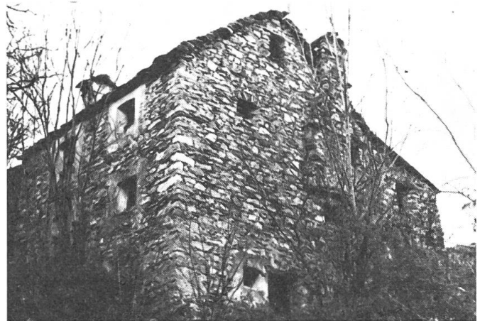
Abb. 4: Zerfallene Scheunen und Ställe sowie mit Ahorn überwachsene ehemals saftige Kuhweiden, kennzeichnen viele Alpen im südlichen Kanton.

rung von Seilbahnprojekten, welche sie selber nicht finanzieren können, zu helfen und zu unterstützen. Unser Verband übernimmt im Rahmen dieser Arbeitsgemeinschaft vor allem die Koordination der beteiligten Parteien (Private, kantonale Stellen, Armee etc.).