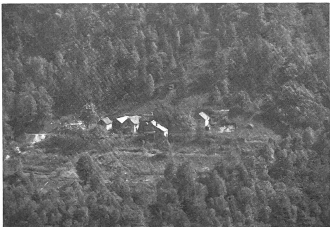
Abb. 2: Diese Alp wurde mit einer Militärseilbahn erschlossen. Rund 800 m Seil trennen Berg- und Talstation. Bevor die Seilbahn gebaut wurde, mussten die Produkte über einen steilen und gefährlichen, zwei-stündigen Pfad auf die andere Talseite «gebuckelt» werden.