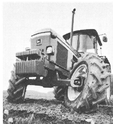
Der neue John Deere-Allrad mit dem engen Wenderadius - verfügbar an 8 John Deere-Traktoren von 60 bis 132 PS.

An der OLMA finden Sie uns in der Halle 6