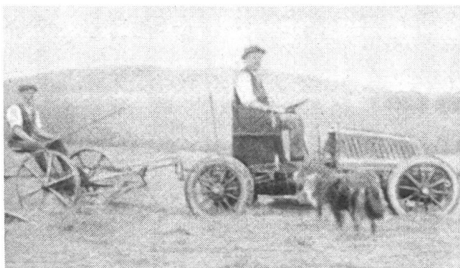
Aus einem Cotteraux-PW hergestellte Zugmaschine (ca. 1917).

Entnommen einem Artikel von H. Beglinger († 1974), dem 1. Leiter des Technischen Dienstes SVLT.