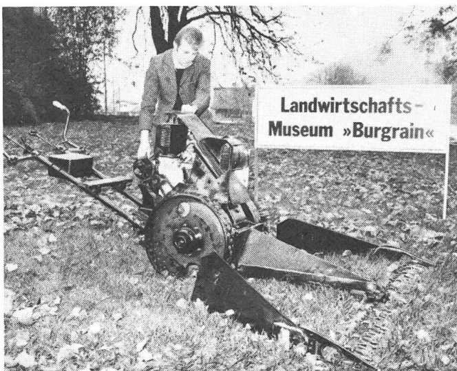
Abb 1: Der Motormäher «Rapid K» Ende der 20er Jahre fabriziert, ist ein interessantes Museumsobjekt geworden.

diese für kurze Zeit zur Verfügung zu stellen. Da dafür je Nummer nur 1–2 Bilder gezeigt werden können, wird man sich gelegentlich gedulden müssen, bis das eingesandte Bild erscheint. Besten Dank für die wertvolle Mitarbeit, die selbstverständlich honoriert wird.