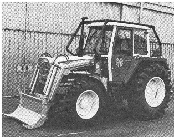
STEYR-Forsttraktor FT 80 ausgerüstet mit Doppel-trommelseilwinde 2 x 5500 kg Zugleistung und Frontpolderschild.

den; es sind dies der STEYR FT 80 (51 kW/ 70 DIN-PS) und der STEYR FT 120 (73 kW/ 100 DIN PS). Beide zeichnen sich durch einen zentralen, unter Last schaltbaren Allradantrieb, Planetenachsen, hydraulische Vierradbremsten und hydrostatische Lenkung aus.