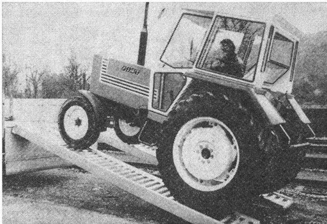
Abb. 1: Verladeschiene Typ SP mit Traktor.

Die Typen SP und STR, mit einer stabilen Seitenführung bzw. Stegrand, eignen sich