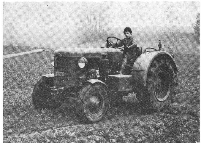
Abb. 1: Bührer-Traktor, Jahrgang 1953, im Einsatz.

Im Zuge der Neuorganisation der Traktoren-Serviceabteilung bei Bührer tritt ab 1.5. 1981 das System «Bührer + Service» in Kraft. Für den Bührer-Traktorenbesitzer bringt dies eine Ausweitung der Garantieleistungen für Ersatzteil-Sicherstellung und Ersatzmotoren. Die Vertragswerkstätten