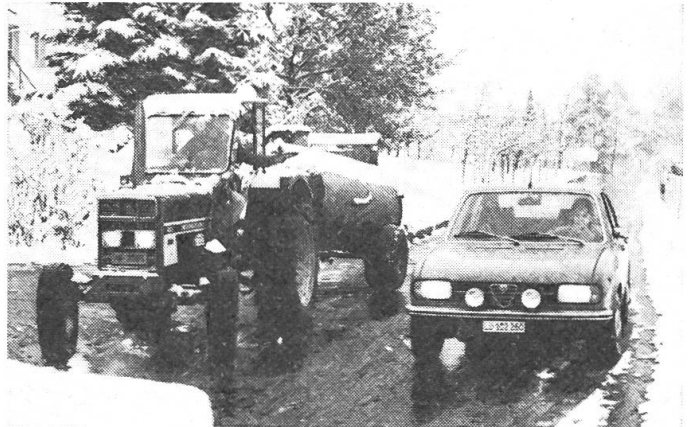
Abb. 3: Rücksicht auch im Strassenverkehr: Ein LU-PW-Lenker bekommt das Handzeichen zum Vorfahren.

Lob. Auffallend ist, dass die Hünenberger Landwirte nicht nur auf ihrem Weg zur Grastrocknungsanlage das freundliche Handzeichen für die übrigen Verkehrsteilnehmer kennen und anwenden – erfreulich ist auch, dass sie sich ganz allgemein verkehrsfreundlich verhalten und den PW-Verkehr nicht hindern. Uebrigens: Der Hünenberger Unfallverhütungsaktion, die ganz still und ohne grosses Aufsehen inszeniert wurde, kommt im Hinblick auf die winterlichen Verhältnisse mit Schnee, Eis und Nebel beim herrschenden Basel – Gotthardverkehr überregionale Bedeutung zu.