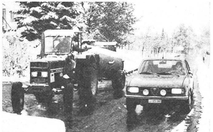
Abb. 3: Rücksicht auch im Strassenverkehr: Ein LU-PW-Lenker bekommt das Handzeichen zum Vorfahren.

Lob. Auffallend ist, dass die Hünenberger Landwirte nicht nur auf ihrem Weg zur Grastrocknungsanlage das freundliche Handzeichen für die übrigen Verkehrsteilnehmer kennen und anwenden – erfreulich ist auch, dass sie sich ganz allgemein verkehrsfreundlich verhalten und den PW-Verkehr nicht hindern. Uebrigens: Der Hünenberger Unfallverhütungsaktion, die ganz still und ohne grosses Aufsehen inszeniert wurde, kommt im Hinblick auf die winterlichen Verhältnisse mit Schnee, Eis und Nebel beim herrschenden Basel – Gotthardverkehr überregionale Bedeutung zu.