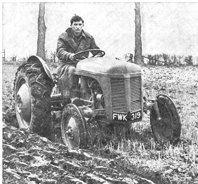
Abb. 2: Ferguson-Traktor vom Typ TE 20. Dieser Typ war der erste Ferguson-Traktor, der 1947 von der Service Company Ltd, Dübendorf importiert wurde.