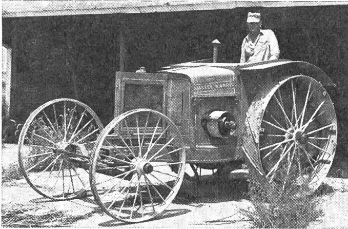
Abb. 4: Erster Massey-Ferguson-Traktor. Hergestellt vor 60 Jahren, Modell Massey-Harris Nr. 1. Er wurde angetrieben durch einen quergestellten 4-Zylinder-Benzinmotor, welcher an der Zapfwelle 12 PS und an der Riemenscheibe 25 PS leistete.

Coventry ist das grösste dieser Art in der westlichen Welt. 85 Prozent aller in der Welt hergestellten Traktoren weisen technische Anlehnungen an das Ferguson-System auf, also eine mechanische Verbindung zum hydraulischen Heben und Steuern von Geräten.