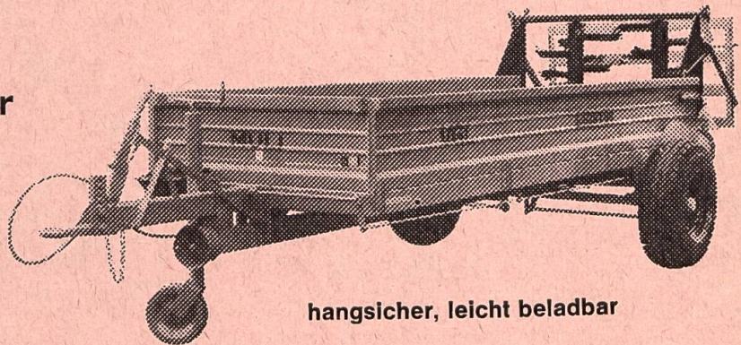
hangsicher, leicht beladbar

NEU im Programm ist der MULI 3 für starke Traktoren.