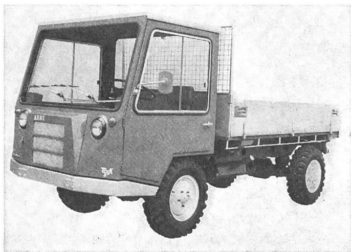
Abb. 3: Aebi Kommunal-Transporter TP 35 K.

im Winter, zum Mähen und Reinigen im Sommer. Eine sehr interessante Maschine, mit Batterie und elektrischem Anlasser ausgerüstet, breiten Rasenreifen, grosser Bodenfreiheit und einem raffinierten Geräte-Schnellanschluss.