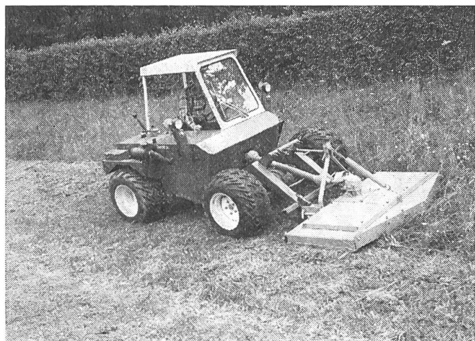
Abb. 2: Aebi Terratrak TT 77 mit seitlich hydraulisch verstellbarem Sichelmäher.