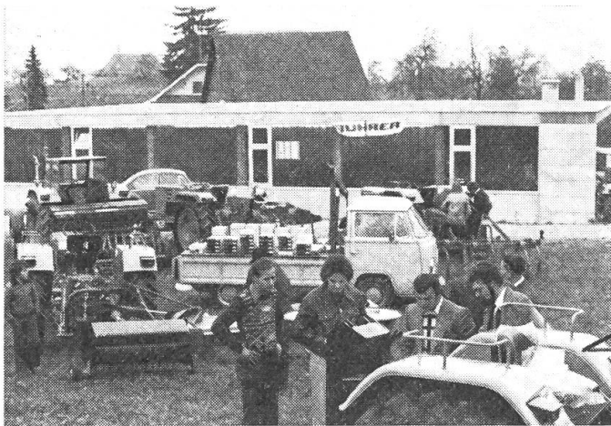
Abb. 2: Teilansicht der Maschinenausstellung hinter der Werkstatt.

Eine grosse Besucherzahl hat am Samstag und speziell am Sonntagmittag der Einladung Folge geleistet und war von dem erstellten Zweckbau verbunden mit Ersatzteillager sehr befriedigt.