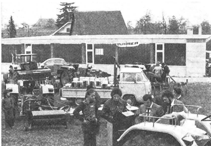
Abb. 2: Teilansicht der Maschinenausstellung hinter der Werkstatt.

Eine grosse Besucherzahl hat am Samstag und speziell am Sonntagmittag der Einladung Folge geleistet und war von dem erstellten Zweckbau verbunden mit Ersatzteillager sehr befriedigt.