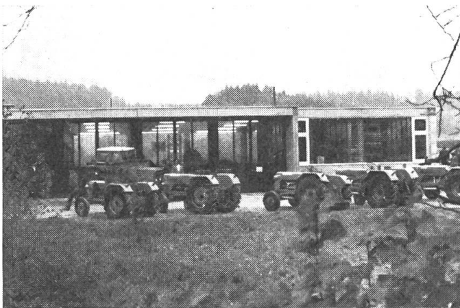
Abb. 1: Ansicht von vorne der Reparaturwerkstatt.

Auf den 8./9. November 1975 lud die Firma MATZINGER AG, Traktoren und Landmaschinen, Dübendorf, ihre Kundschaft zu einem «Tag der offenen Tür» in ihre neue Werkstatt in Abtwil AG ein.