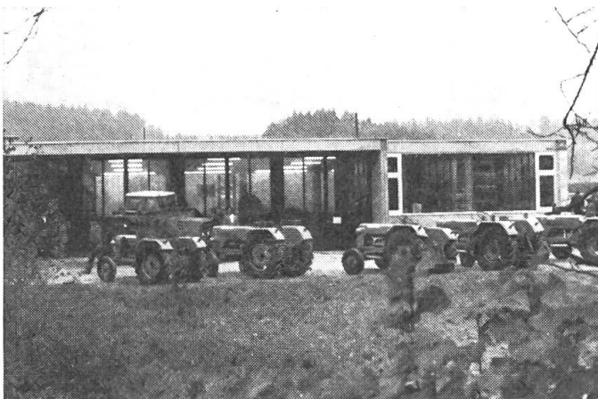
Abb. 1: Ansicht von vorne der Reparaturwerkstatt.

Auf den 8./9. November 1975 lud die Firma MATZINGER AG, Traktoren und Landmaschinen, Dübendorf, ihre Kundschaft zu einem «Tag der offenen Tür» in ihre neue Werkstatt in Abtwil AG ein.