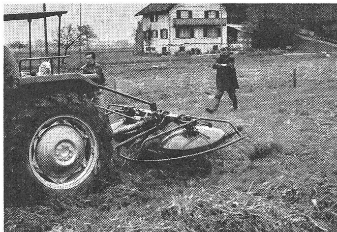
Abb. 4: An Kreiselzett-Wendern werden laufend Verbesserungen vorgenommen. Nicht alle Massnahmen zeigen aber den gewünschten Erfolg.

Augenmerk ist dabei noch dem Erntegut-Verlust auf dem Feld zu widmen.