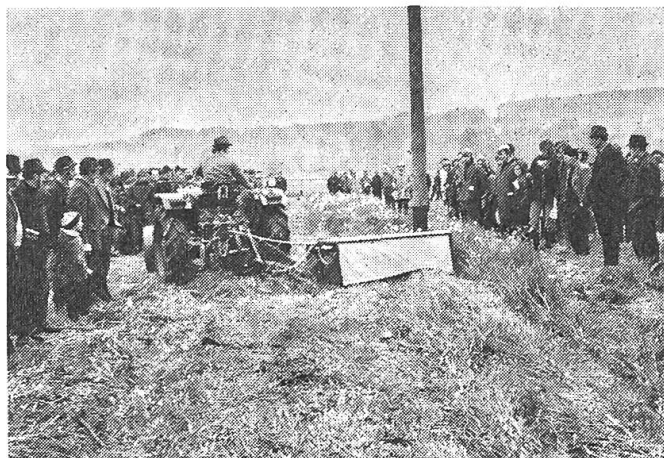
Abb. 1: Scheiben- und Trommelmähwerke können z. Z. die Finger- und Doppelmesserbalken noch nicht ganz verdrängen. Gelingt ihnen dies wohl erst, wenn für sie auch Telefonstangen keine Hindernisse mehr darstellen?

Die Traktormähwerke mit Messerbalken, auch mit dem Doppelmesserbalken, sind heute bekannt. Die