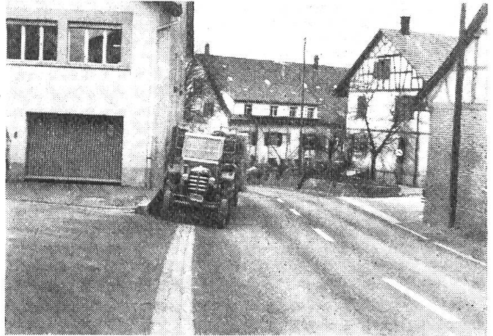
Abb. 2: Ansicht von oben. Das ohnehin schmale Trottoir ist nicht mehr begehbar (!). Den Automobilisten präsentiert sich eine Kurve, die wegen des parkierten Traktorzuges noch unübersichtlicher ist.

wenig konnte die Tafel gesehen werden, welche eine etwas weiter oben liegende zweite Einmündung signalisiert. Das Ueberholen des Traktorzuges war nur möglich, wenn eine Kollision mit einem von oben her nahenden Fahrzeug in Kauf genommen werden wollte, denn die Strasse ist lediglich 6 m breit. Die Heufuder beanspruchten ihrerseits und zwar in einer leichten Kurve zusätzlichen Platz. Ein Einbiegen von der Nebenstrasse auf die Hauptstrasse war nur für «Lebensmüde» empfehlenswert. Die Einmündung ist ohne den parkierten Traktorzug schon unübersichtlich genug.»