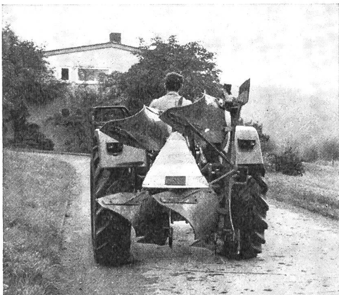
Abb. 1: Der nach BAV vorgeschriebene Signalkörper.