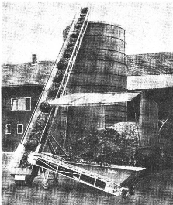
Gamo-Universalförderer und Horizontal-Zubringer für die Silo-Beschickung ab Ladewagen. (Fa. Kunz, Burgdorf)

so empfiehlt sich unbedingt ein Universalband. Erst die Praxis zeigt dann, bei wieviel kleinen Arbeiten ein solches Förderband ein arbeitssparender Helfer ist.