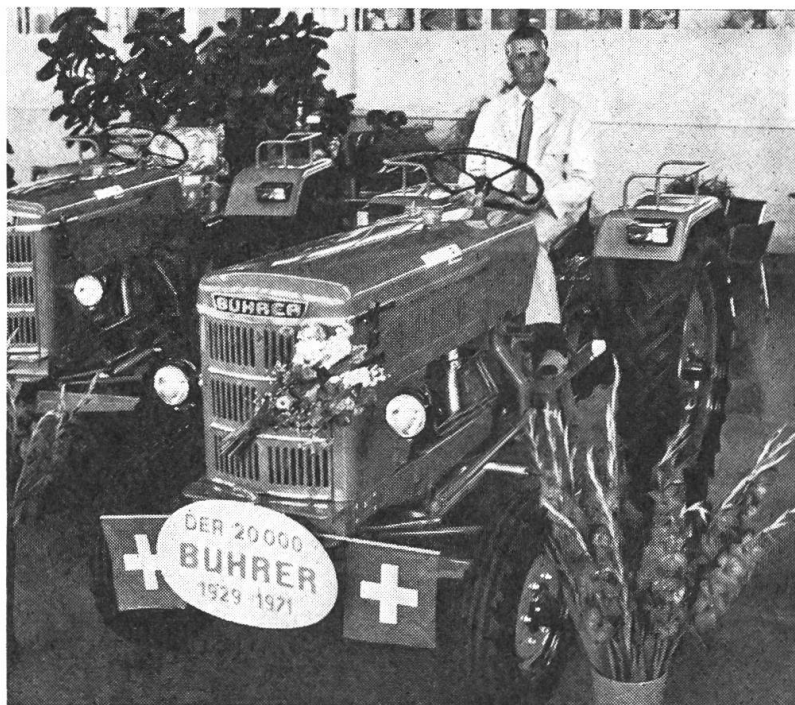
Erste Bekanntschaft mit dem neuen «Herrn».