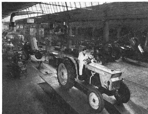
In Abständen von nur wenigen Minuten verlassen «Centaurio» Traktoren die Montagebänder im SAME-Werk in Treviglio.

werkstätte für Traktoren und Landmaschinen zu erstellen und einzurichten. Zusätzlich liefert SAME mehrere fahrbare Werkstätten für die Gegenden, wo sich feste Werkstätten nicht eignen.