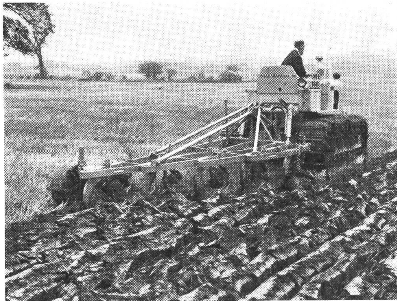
Abb. 1: Die neue «Fowler Marshall» Raupe 70 PS mit Ransomes Aufsattel- pflug (5-furchig).

Einen schweren Aufsattel-Beetpflug mit vier oder fünf Furchen zeigt man bei Ransomes, Ipswich. Ausserdem einen superbreiten Kultivator mit 57 Zinken.