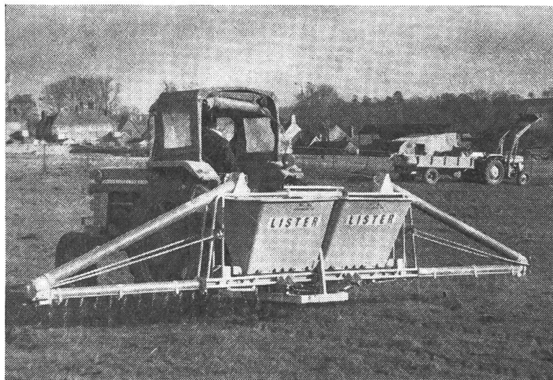
Abb. 4: Düngerstreuer «Lister». Die beiden Behälter fassen zusammen 675 kg Körner-Dünger. Die Tagesleistung soll 32 bis 40 ha betragen. Der Dünger wird den beiden 6 m langen Balken durch je eine Schnecke zuge- führt. Bei einer Geschwin- digkeit von 9 km/h kann die Streumenge genau eingestellt werden.

Im Sämaschinenbau setzen sich immer mehr kombinierte Samen- und Dünger-Drillmaschinen durch. Eine sehr interessante Lösung zeigte man bei Allis-Chalmers, Stamford. Hier wird der Dünger mit kleinem Abstand neben der Saat abgelegt und ist für den Keimling in erreichbarer Nähe. Samen- und Düngerbehälter haben grosses Fassungsvermögen (250 l).