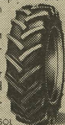
V10 SUPER-TRAC SOL

Auch die Lebensdauer eines Reifens ist Geld wert, so gut wie die Zeit.