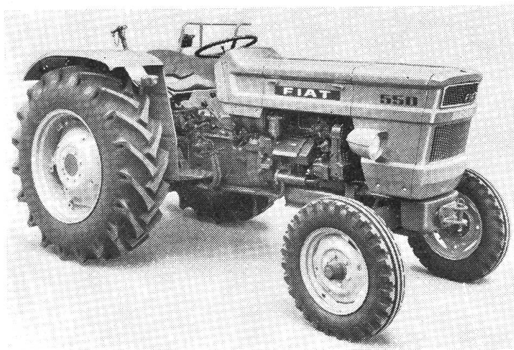
Fiat 1968 (Mod. 550)

Trotz der Perfektion des Modells 1968 empfindet man für das Modell 1918 ein bestimmtes Gefühl von Ehrfurcht und Wehmut . . . Doch wozu in Sentimentalität machen. Die heutige moderne, impulsive Zeit rollt unaufhaltsam weiter. Es wird in unserer Zeit besonders vom Bauern viel, ja geradezu Unmenschliches verlangt, dazu eignet sich das Modell 1968 bestimmt besser.