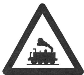
Bahnübergang ohne Schranken

Die ersten gelb-schwarzen Signale sind aufgestellt und können bereits in der Nähe von Waffenplätzen sowie auf Zufahrtsstrassen zu militärischen Schiess- und Uebungsplätzen angetroffen werden.