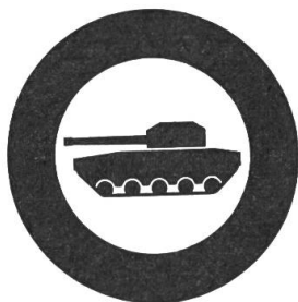
Verbot für Panzer