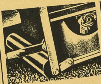
Einstellung der Schnitthöhe mit Tastwalze. Rollwerk passt sich Bodenunebenheiten an.

Vom IMA anerkannt Verlangen Sie bitte den aus- führlichen Prospekt