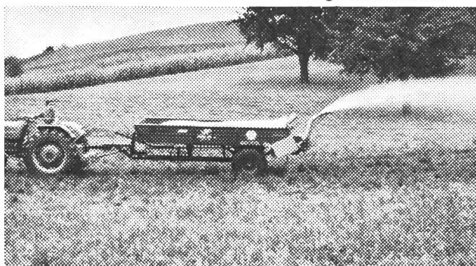
Der «JF»-ALLZWECKWAGEN als Saug- und Druckfaß beim Güllen (12 m Streubreite). Der Antrieb der Zentrifugal- und Füllpumpe erfolgt über die Zapfwelle.