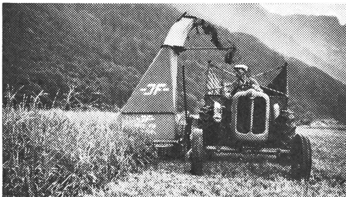
Der «JF»-MÄHFELDHÄCKSLER beim Mähen und Aufladen von Gras. Er ist leicht in der Bedienung und vielseitig in der Verwendbarkeit.

Die «JF»-Fabriken produzieren jährlich über 30 000 Landmaschinen. Daher absolut konkurrenzlose Preise! «JF»-Maschinen bieten viel — kosten aber wenig!