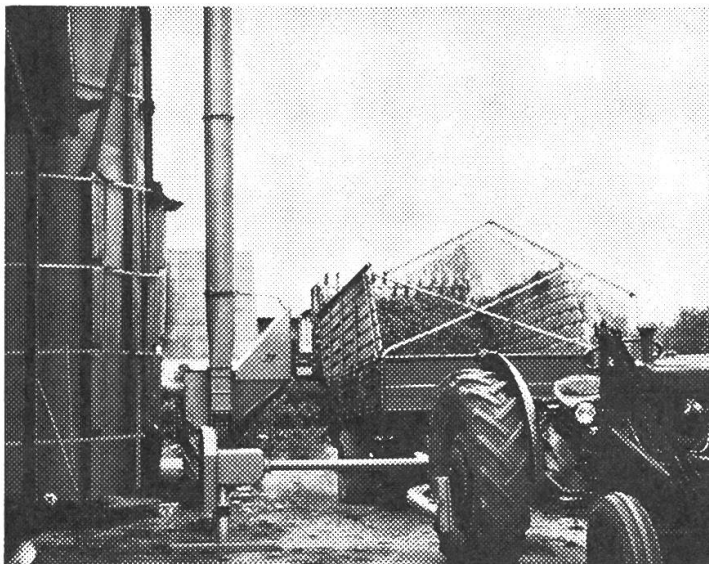
Das «JF»-SILOWURFGEBLÄSE (Zapfwellenantrieb) und der «JF»-Allzweckwagen (als Häckselwagen) mit dem Kombi- und Seitenabladern beim Füllen des Silo.