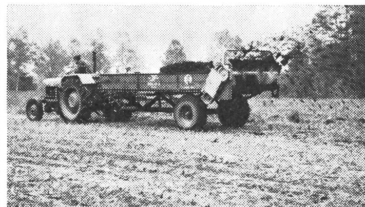
Der «JF»-ALLZWECKWAGEN mit Breitstreuwalze (4 m) beim Miststreuen. Die Streuarbeit ist erstaunlich. Außerdem gewährleistet der Wagen eine unübertroffene Betriebssicherheit.