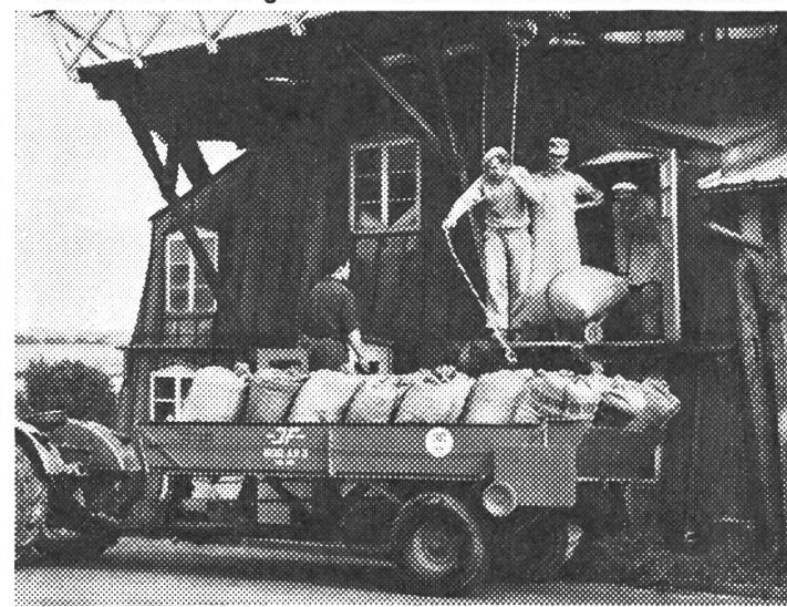
Der «JF»-ALLZWECKWAGEN als Transportwagen leistet große Dienste auf jedem Hof und bei jeder Arbeit. Dieser Wagen ist ein wirklicher Allzweckwagen. Als 2,5-, 3-, 4- und 5-Tonnen-Wagen lieferbar.

Verkaufsbüro: 6318 Walchwil ZG, Tel. (042) 7 82 91