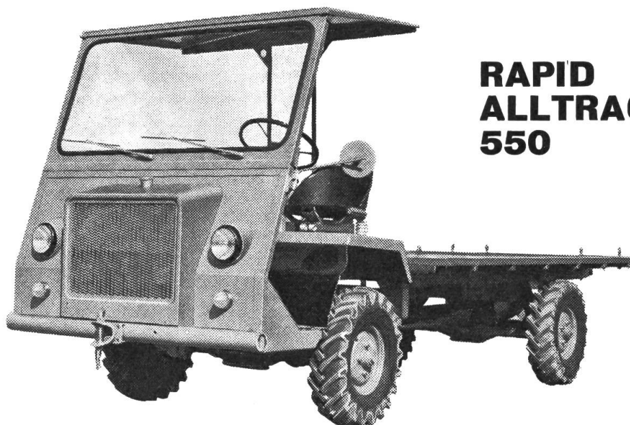
RAPID ALLTRAC 550

Der neue Transporter für Mittelland und Berggebiet: robust wie ein Landwirtschaftstraktor, bequem wie ein Personenwagen. Sein 9-Gang-Getriebe verleiht ihm beste Steigfähigkeit. Der Fahrkomfort ist ausgezeichnet dank