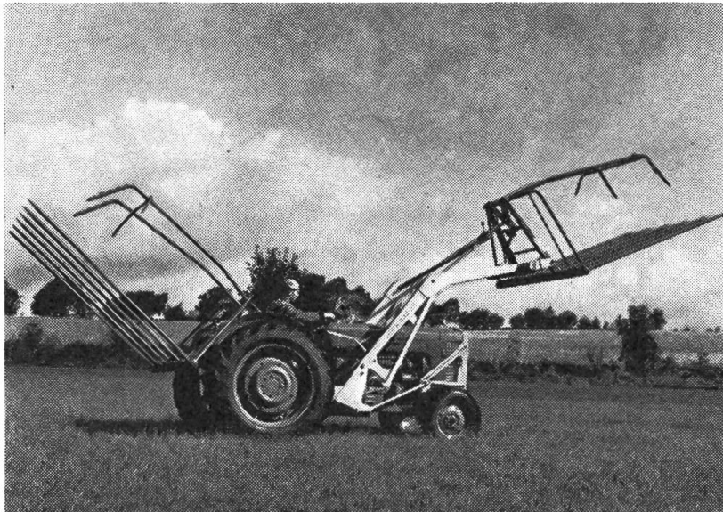
Abb. 1: Heu-Schiebesammler an der Dreipunktaufhängung und am Frontlader des Traktors angebaut.

Wir unterscheiden jedoch zwei Grundtypen: der für Frischgut (Grünfutter, Silage, Welkgut) hat lanzettartige Federstahlzinken mit Löffelspitzen von etwa 1 m Länge bei engem Zinkenabstand (Siloschwanz) ohne Greiferzange. Der Trockenguttyp, also für Heu, ist mit 2 m langem Rohr und doppelt so breitem Abstand ausgerüstet und besitzt einen Klappbügel zum