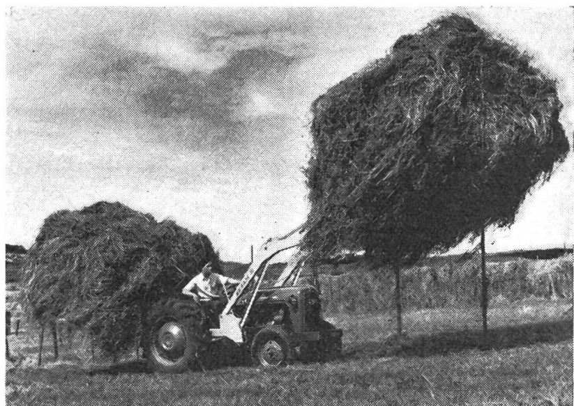
Abb. 2: Heck- und Frontschiebesammler im Einsatz.