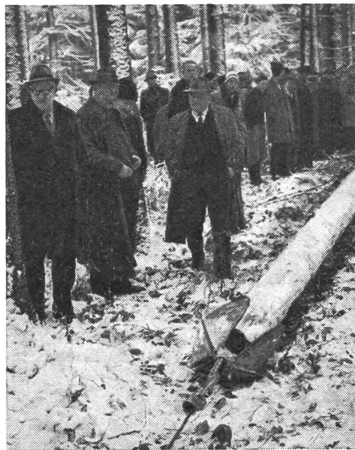
Rücken von Stammholz mit der neuen, von der Forstwirtschaftlichen Zentralstelle entwickelten Schleppzange «Haifisch».