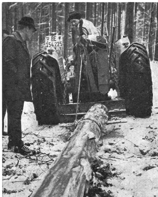
Rücken von Langholz durch Traktor mit Rückwinde und Hydraulikplatte