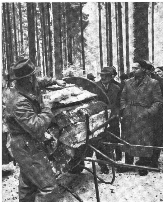
Sterbündelung mit dem vielerorts bereits gut eingeführten Fideriser Bündelwagen.