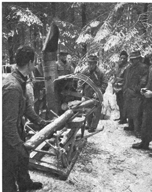
Schälen von Papierholz mit der beweglichen und bewährten finnischen Schälmaschine «Cembro».