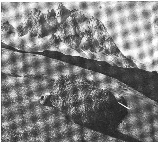
Abb. 3 Mit dem Zapfwellenanhänger (Nutzlast 900 kg) wird der Rapid 606 zur leistungsfähigen Zug- maschine für den Bergbetrieb

ben uns nicht nur eine interessante, sondern auch eine in angenehmer Erinnerung bleibende Führung durch die erweiterten modernen Werkhallen geboten und dafür danken wir bestens.