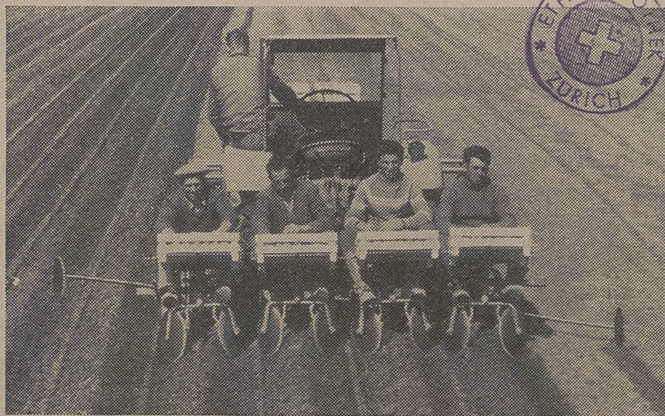
Kartoffelsetzen 4-reihig mit unseren pat. Setzautomaten. Hangsteuerung beim Setzen möglich.