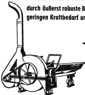
SILU- UND GEBLÄSEHÄCKSLER

führend auf dem europäischen Markt, in Deutschland meistgekauft, für alle Betriebsgrößen und Leistungen, vom IMA anerkannt